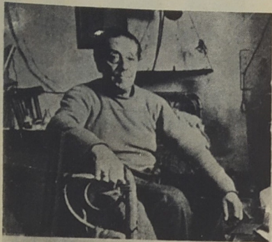
SANDRO PENNA. PREMIO BAGUTTA

Sandro Penna è nato nel 1906. Ragioniere per diploma e poeta per vocazione, ha condotto una vita disordinatissima facendo di tutto. E' considerato uno dei più grandi poeti italiani contemporanei. Di lui, editi da Garzanti, troviamo: "Tutte le poesie", "Poesie" (scelta fatta da Penna stesso con l'aggiunta di versi all'edizione di "Tutte le Poesie"), "Un po' di febbre" (narrativa), ed infine il libro di poesie "Stranezze" uscito poco prima della sua morte avvenuta nel 1976.